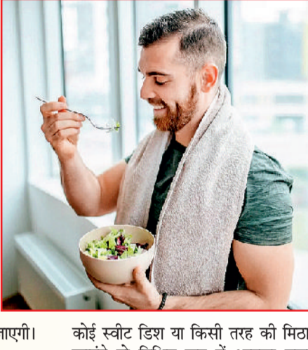
कोई स्वीट डिश या किसी तरह की मिठाई खाएंगे तो निश्चित रूप में आपका वजन बढ़ेगा। बाजार में ड्राई फ्रूट्स से बनी बहुत सारी मिठाइयां उपलब्ध रहती हैं। आप सामान्य मिठाई के बजाय उनका सेवन कर सकते हैं। इस तरह आप स्वीट डिश खा सकते हैं और आपका वजन भी नहीं बढ़ेगा।