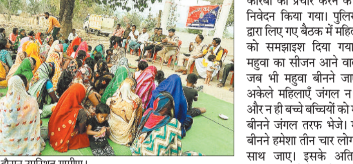
चौपाल के दौरान उपस्थित ग्रामीण।

हरिभूमि न्यूज कोरबा पुलिस अधीक्षक सिद्धार्थ तिवारी के दिशा निर्देश में जनप्रतिनिधि एवं किसानों का बैठक लिया जाए सजग कोरबा के तहत उन्हें जागरूक किया जाए। थाना व चौकी प्रभारियों को उनके थाना क्षेत्र अंतर्गत गांव में रहने वाले ग्रामीण कृषक मितानिन एवं जनप्रतिनिधियों का बैठक बुलाया जा रहा है। इसी कड़ी में थाना व चौकी प्रभारी एवं उनके स्टॉफ के द्वारा ग्राम पंचायत भवन में जन प्रतिनिधि और ग्रामीणों का बैठक लिया गया बैठक में उपस्थित लोगों को वर्तमान में सरहदी जिलों में हुई उठाईगिरी की घटनाओं के संबंध में लोगों को बताया गया और किस गलती के