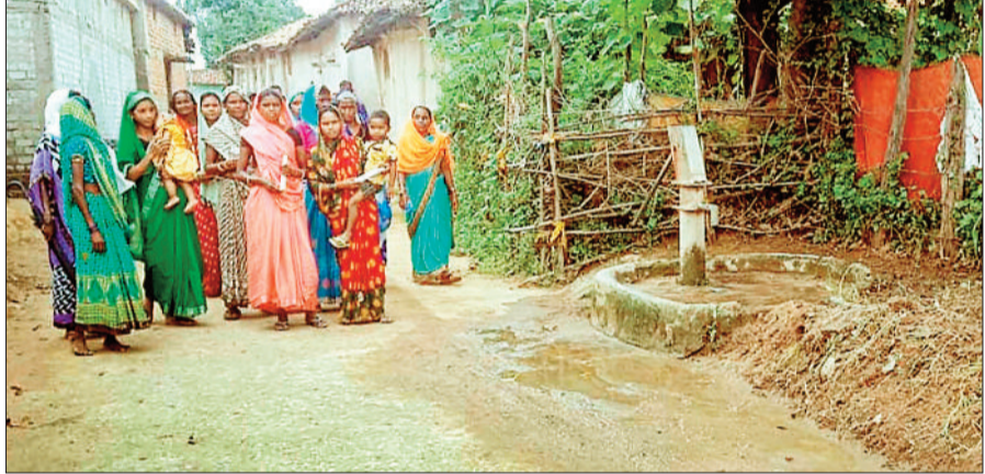
सोनगुड़ा के ग्रामीण जहां गर्मी में प्रतिवर्ष खड़ा होता है जलसंकट।

हरिभूमि न्यूज | कोरबा जिला मुख्यालय से महज 20 किलोमीटर दूर और दर्री बांध के नजदीक होने के बाद भी ग्राम सोनगुड़ा के खेत और ग्रामीण दोनों की प्यास नहीं बूझ रही है। पथरीली