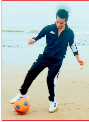
साथ। फुटबॉल खेलने के कारण मैं दिनभर सक्रिय रहता हूँ, इससे शरीर लचीला बनता है