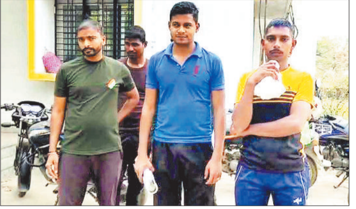
ओपन परीक्षा देने पहुंचे यूपी के छात्र।

हरिभूमि न्यूज कोरबा राज्य सरकार द्वारा 9 मार्च से शुरू की गई ओपन बोर्ड परीक्षा दिलाने उत्तर प्रदेश से 24 छात्र जिले के तिलकेजा परीक्षा केन्द्र पहुंचे थे। ग्रामीणों की शिकायत पर इस मामले में शिक्षा विभाग ने संज्ञान लेकर माध्यमिक शिक्षा मंडल के सचिव से परीक्षा के आवेदन के संबंध में जारी की गई शर्तों की जानकारी मांगी है, वहीं उरगा पुलिस उन छात्रों को अपने साथ ले गई है।