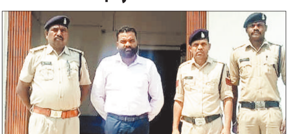
पुलिस गिरफ्तार में आरोपी।